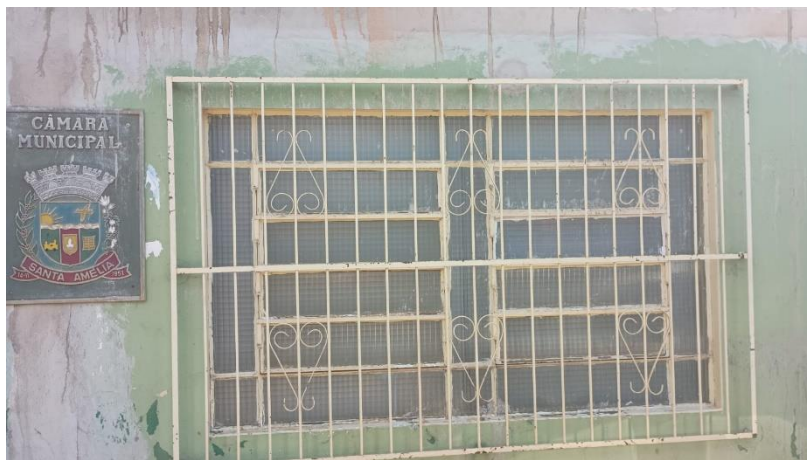
FOTO 19 – JANELA DA SALA DO DEPARTAMENTO JURÍDICO/FRENTE DO PRÉDIO