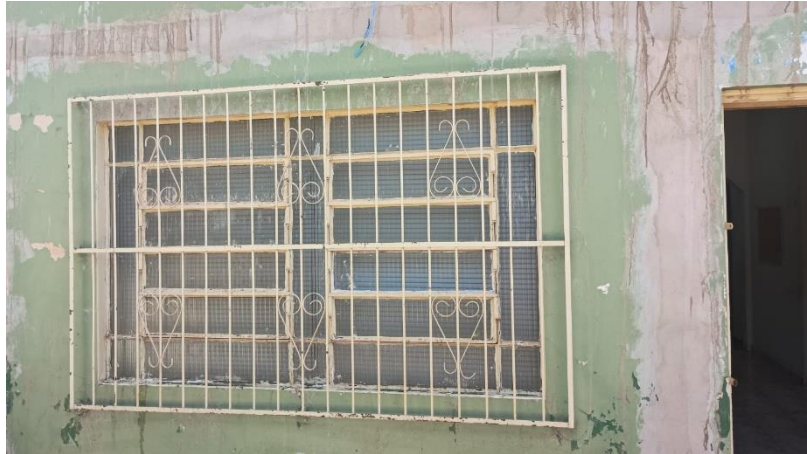
FOTO 18 – JANELA DA SALA DEPARTAMENTO DO LEGISLATIVO/FRENTE DO PRÉDIO