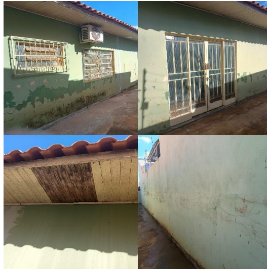
FOTO 15 – IMAGENS DA LATERAL DIREITA DO PRÉDIO E A PORTA DO PLENÁRIO